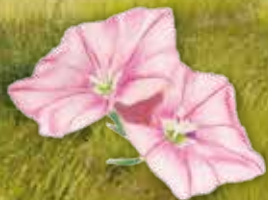
LISERON CANTABRIQUE

Sèchebec viendrait de l'expression " qui sèche le bec " car la végétation y est très rase ! Autrement dit, un lieu où il fait sec, où l'on a soif !