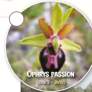
OPHRYS PASSION (mars - avril)

Aujourd'hui, le site est caractérisé par une mosaïque de milieux naturels composée de pelouses calcaires, de fourrés et de forêts qui lui confèrent une richesse biologique exceptionnelle.