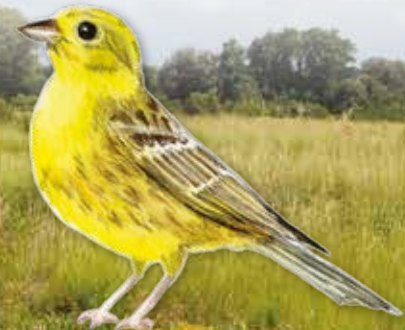
BRUANT JAUNE