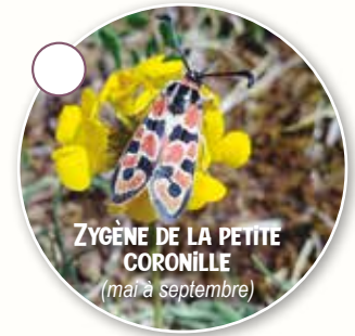
ZYGENE DE LA PETITE CORONILLE (mai à septembre)