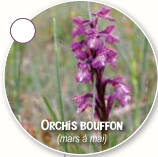
ORCHIS BOUFFON (mars à mai)

Sa gestion environnementale est effectuée par le Conservatoire d'espaces naturels.