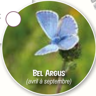
BEL ARGUS (avril à septembre)