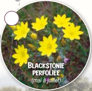
BLACKSTONIE PERFOLIÉE (mai à juillet)